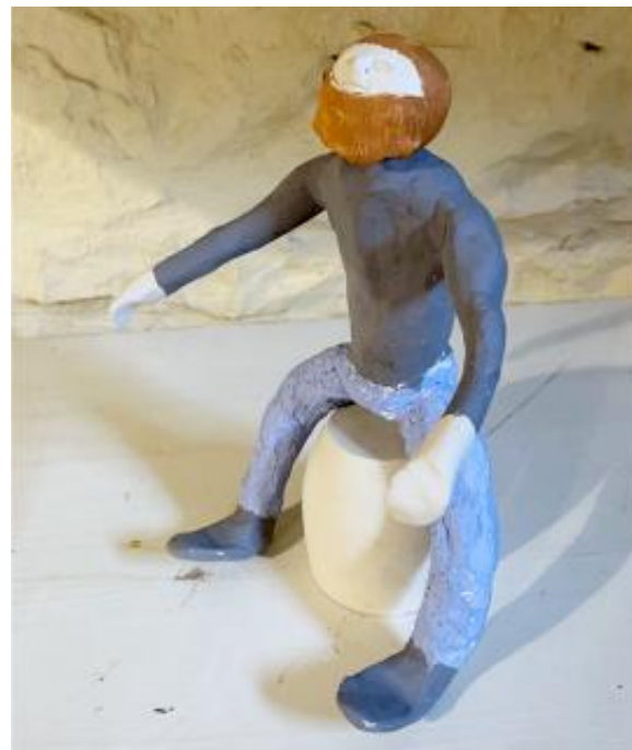
Photo prise dans le cadre du cours « Céramique » à l'atelier Gee Céramique