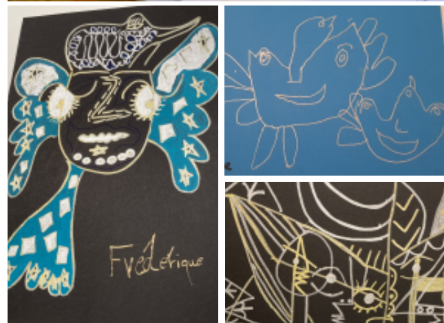
Ci-contre: photos prises dans le cadre du cours « dessin-peinture: travail sur Picasso »